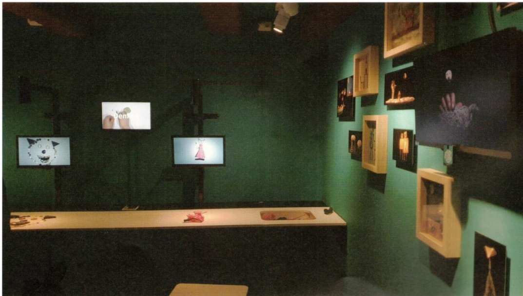
10 TAMTAM installatie in Speelgoedmuseum

www.hetspeelgoedmuseum.nl www.tamtamtheater.nl